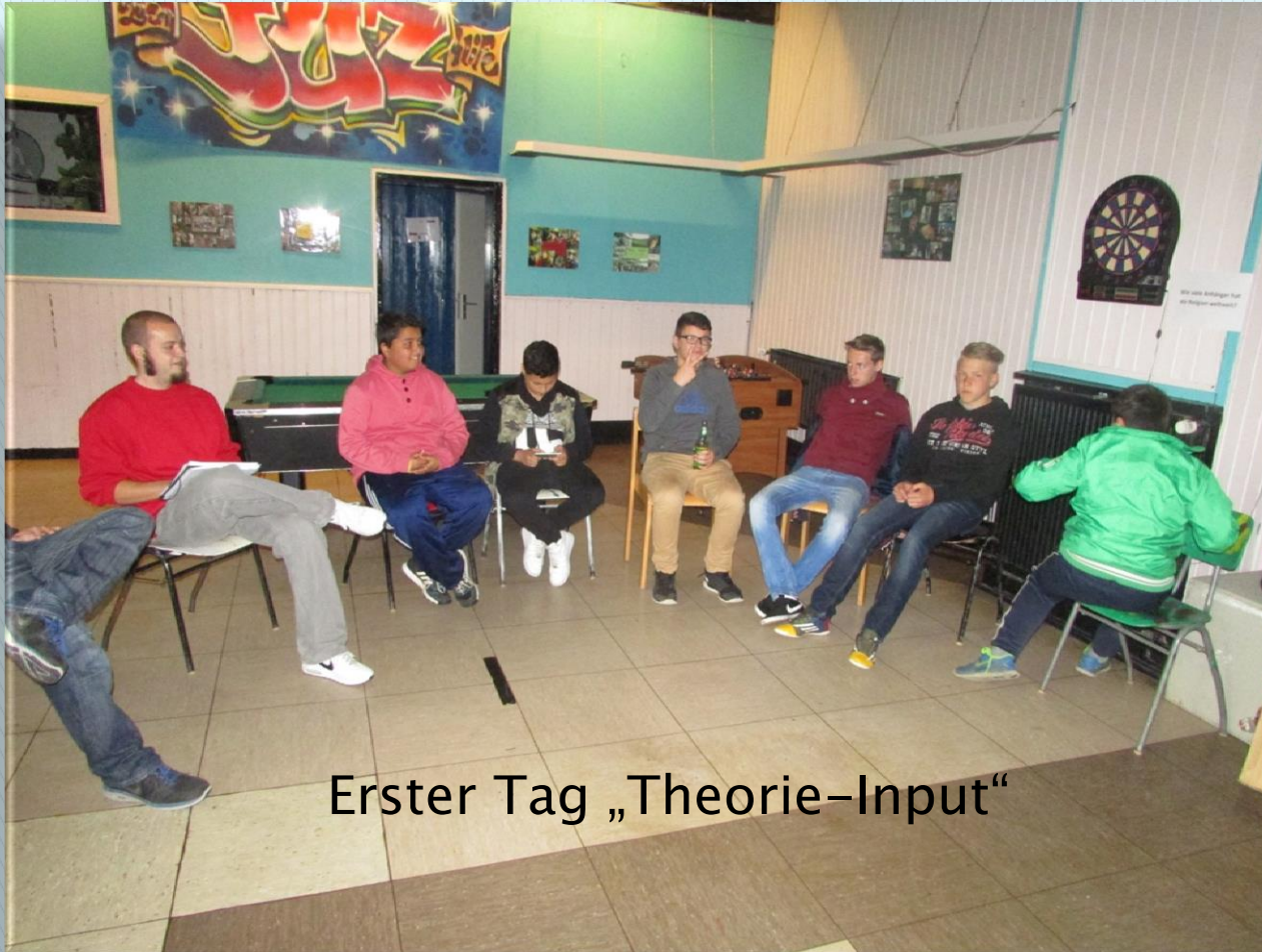
Erster Tag „Theorie-Input“