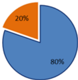
Ordentliche Aufwendungen Ansatz 2013