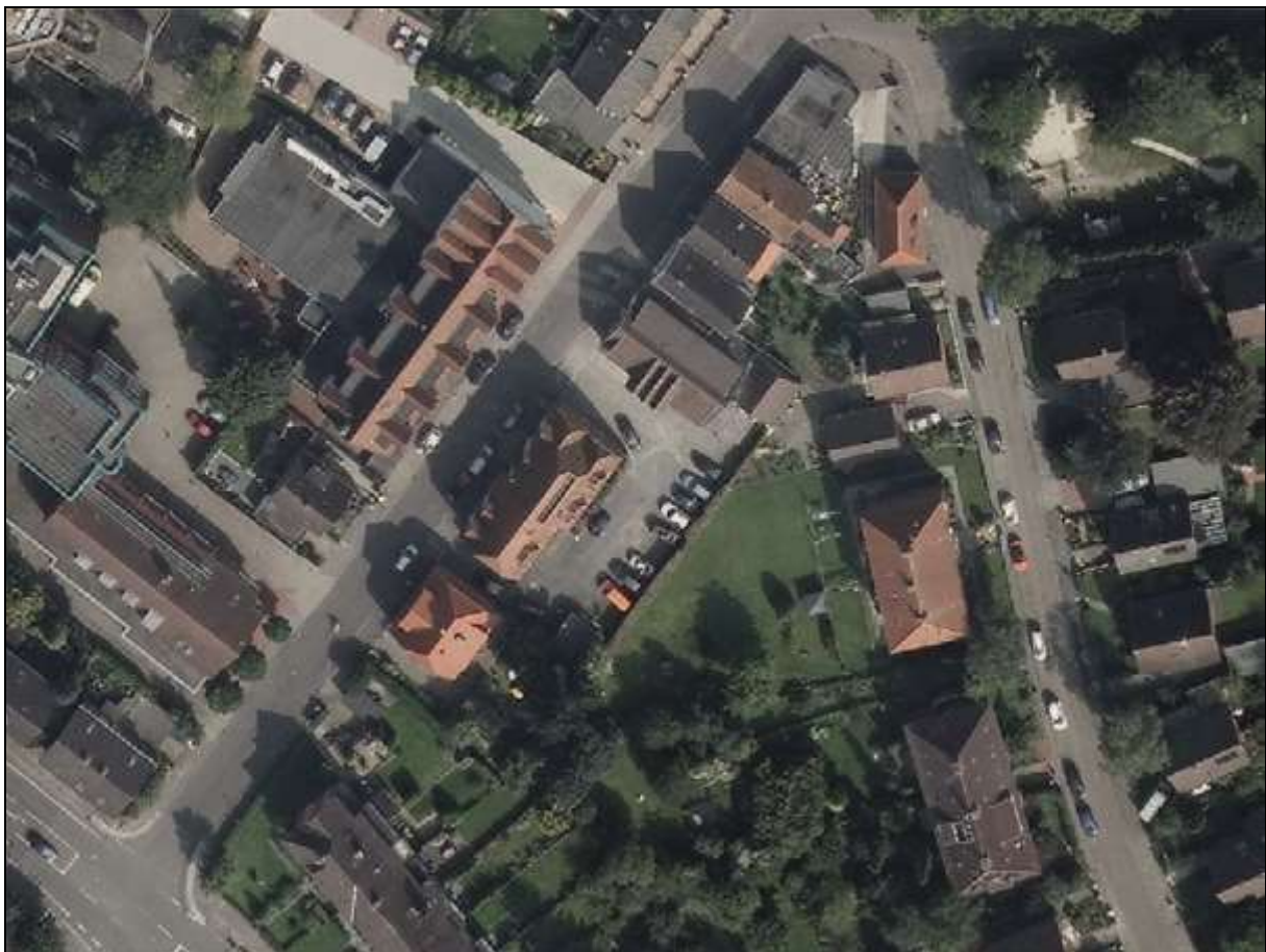
Abb. 2: Aufsicht B-Planbereich Gebäude- und Grünflächen

Innerhalb der Gärten finden sich Scherrasenflächen mit begleitenden Beeten, in denen verschiedene Stauden und gartenübliche Blühpflanzen vorhanden sind. Entlang der rückwärtigen Hotelflächen haben Kletterpflanzen den Grundstückszaun großflächig überwachsen.