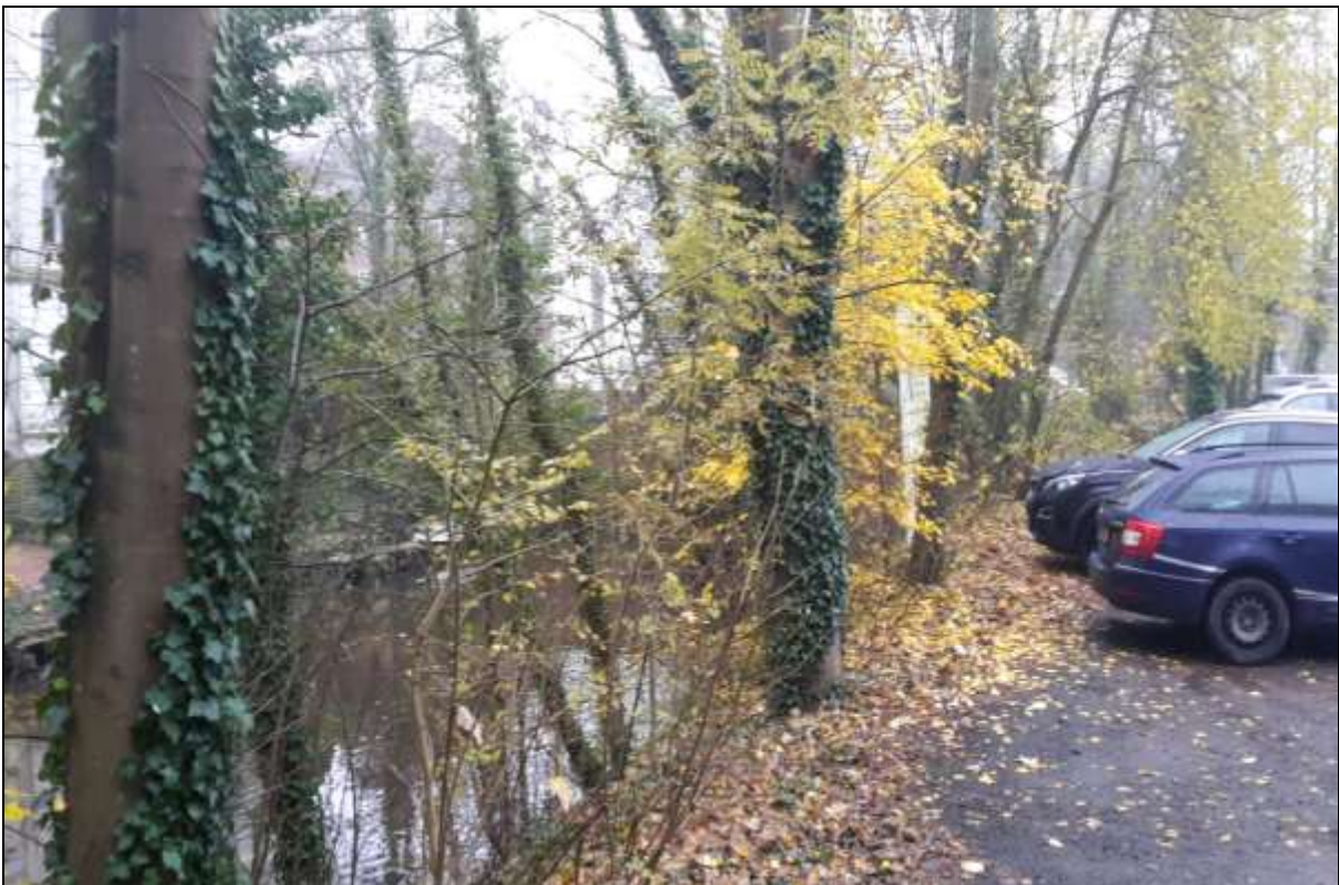
Bild 2: Bäume am südlichen Rand; geschützt gemäß Emdener Baumschutzsatzung