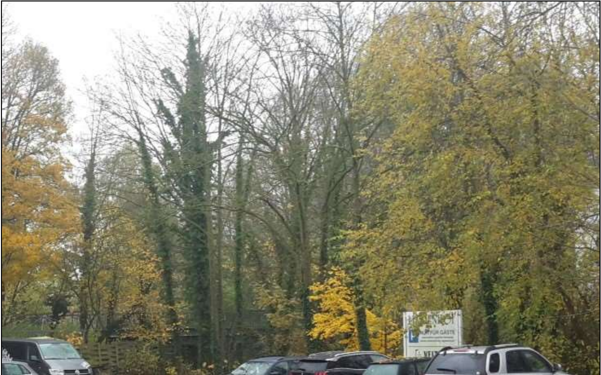
Abb. 3: Altbaumbestand entlang der südlichen B-Plangrenze mit potentiellen Fledermaushabitaten

Derzeit sind keine Baumfällungen vorgesehen. Sollen jedoch während des Bauverlaufs oder später durch Schädigungen der Bauarbeiten Bäume gefällt werden müssen, ist nachfolgend vorzugehen.