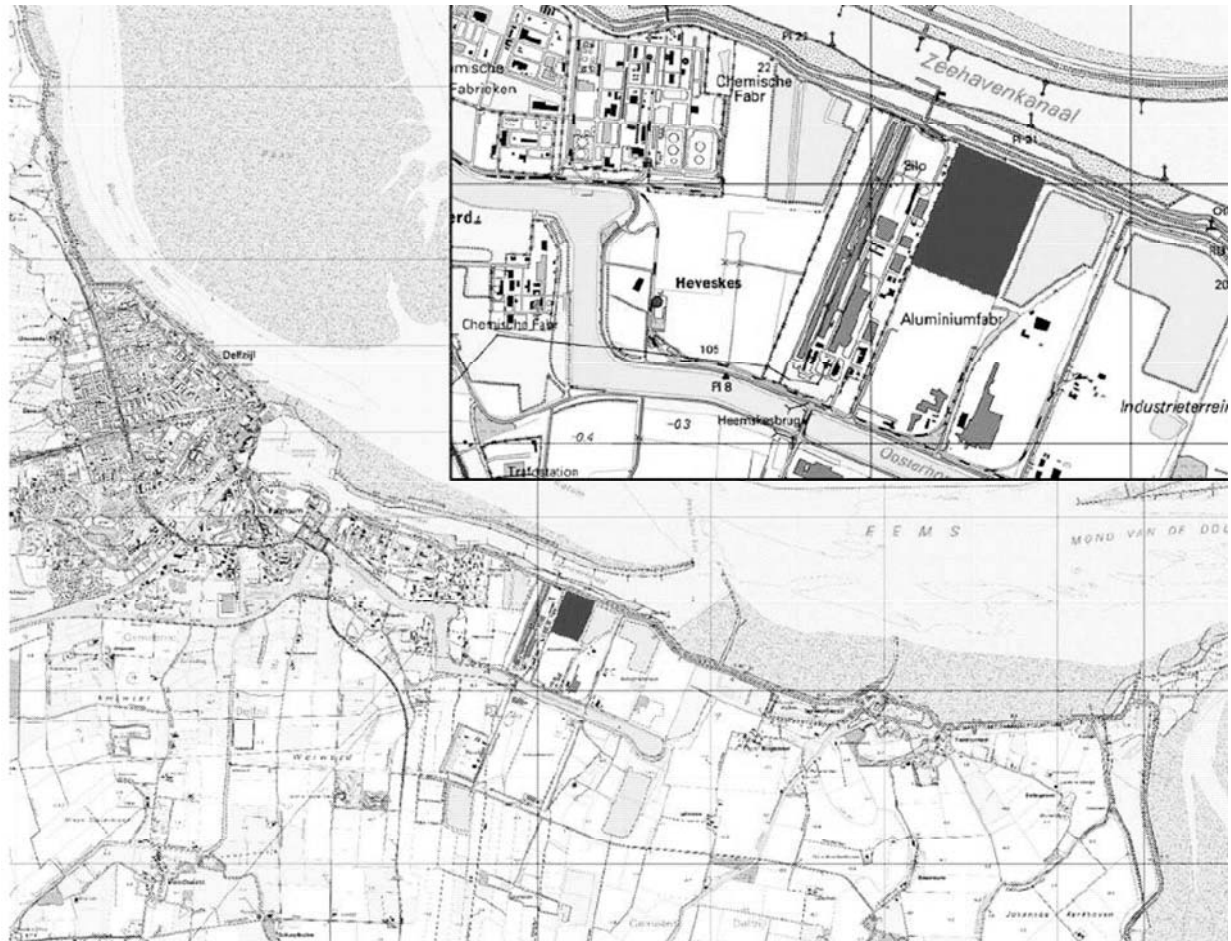
Abbildung 1-1 Standort Biomassekraftwerke Aldel in Delfzijl