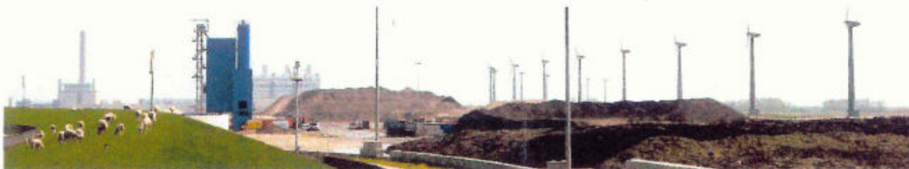
Foto achterzijde inrichting (met opslagdepots/betoncentrale) (bron: www.Eemsdelta.nl ; juni 2006)