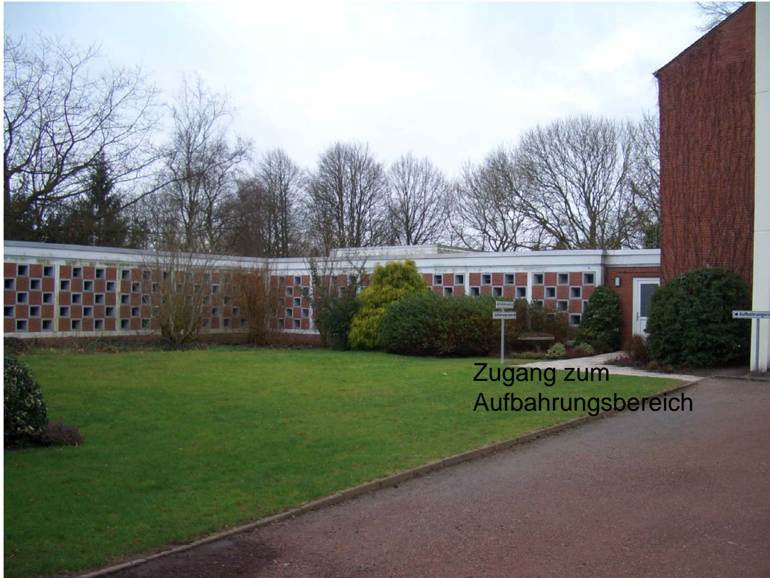
Zugang zum Aufbahrungsbereich