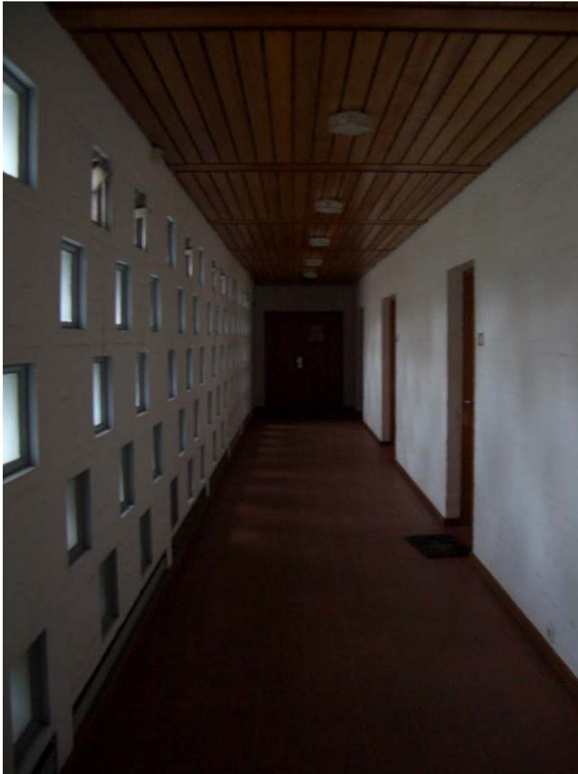
Zugang über die Verwaltung