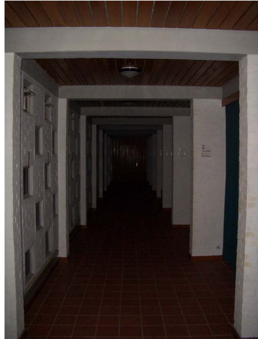
Flurbereich vor den Aufbahrungsräumen